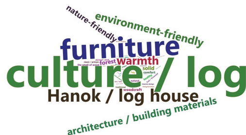
Fig. 2. Word cloud for images related wood.

Among the images for wood and wood culture, the common responses that were above 5% were those pertaining to the use of wood as a material, such as a furniture, Hanok, log house, architecture, and building materials. Environment friendly, nature friendly, forest, and warmth were found to be a frequency above 5% and 2% in the images related wood and wood culture, respectively. Opinions related to cultural