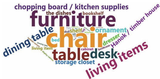
Fig. 4. Word cloud for what want to make in wood cultural experience.

This study investigated what the respondents would make if they participated in a wood culture experience program in the form of subjective responses. The results were visualized and presented using a word cloud according to the response ratio (Fig. 4). The response rate was in the following order: chair (17.3%), furniture (13.3%), table (10.3%), desk (8.4%), and living