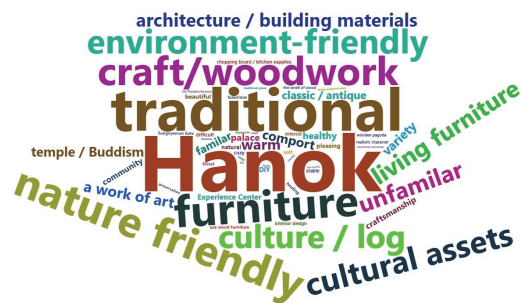
Fig. 3. Word cloud for images related wood culture.